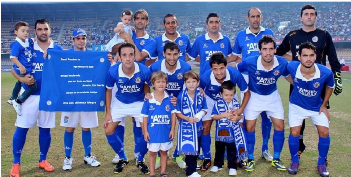
Plantilla 2013-2014 Xerez Deportivo FC./ Xerez 1911