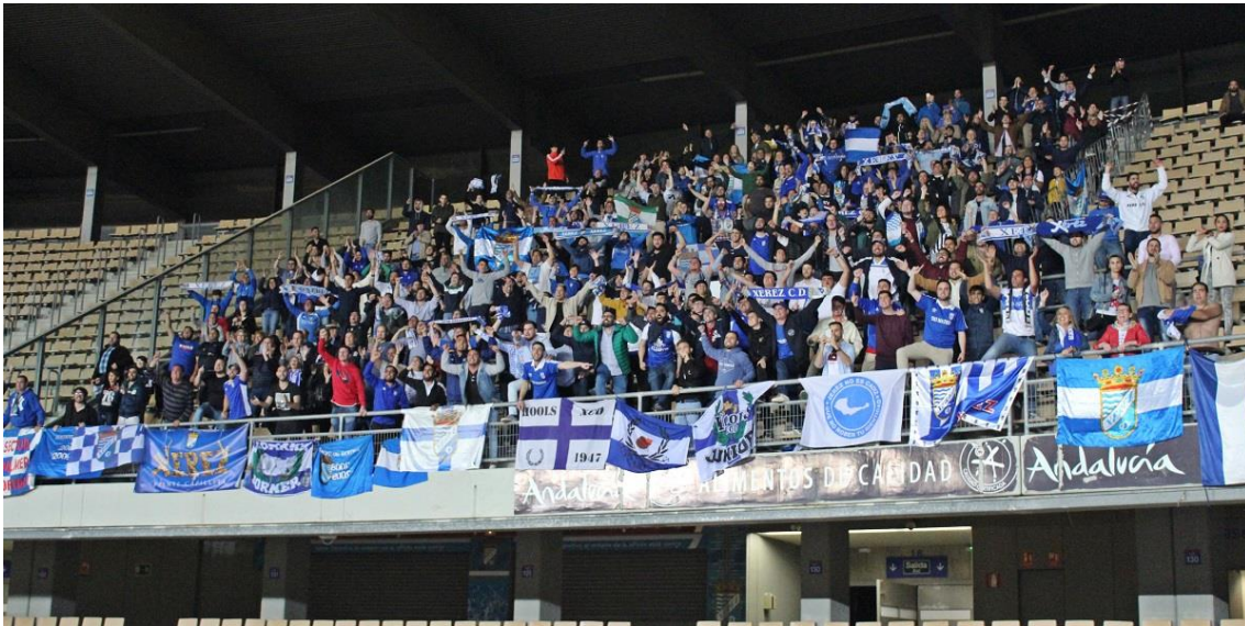
Los Hools XCD durante el Xerez DFC-Xerez CD de la campaña 18-19.

tenemos que estar pendientes de la viabilidad del club, en problemas de impagos, en salir siempre en noticias negativas. Ha cambiado todo”.