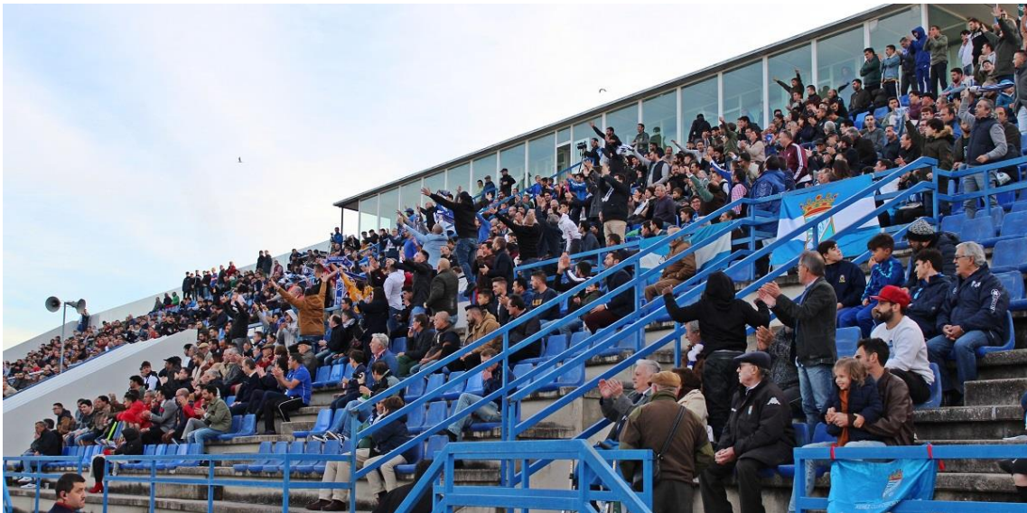
Estado de la grada en La Juventud durante un enfrentamiento directo entre ambos equipos.

La convivencia de dos equipos como Xerez CD y Xerez DFC en la ciudad desde el año 2013 ha estado marcada por la tensión. Una tensión presente en todos los ámbitos del fútbol. Entre los grupos ultras, los aficionados e incluso entre las directivas y representantes institucionales de ambos clubes.