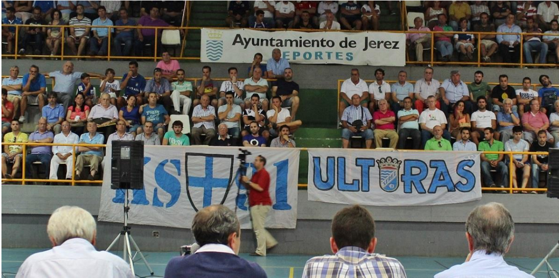
Imagen de la Asamblea celebrada el verano de 2013 en el Ruiz Mateos.

La mayoría de socios votó a favor de la creación de un nuevo club sano, sin deudas y dirigido por los propios aficionados, todo en vista de que el Xerez CD desaparecería en cuestión de días. Eso nunca ocurriría.