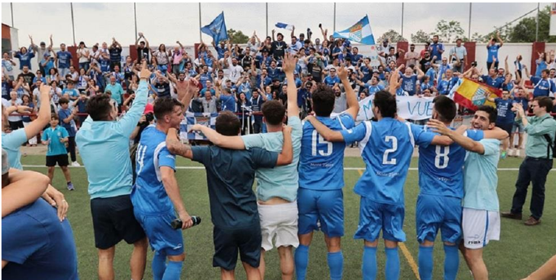
Ascenso a Tercera División, Xerez CD.