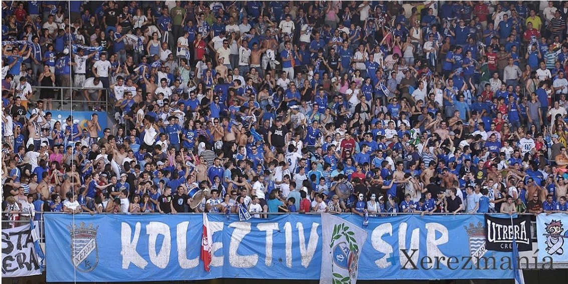
Kolectivo Sur durante un partido en Chapín.

nuestra sede para dar facilidad a los socios del Kolectivo Sur. Hubo una votación de más de 100 personas y salió una mayoría de empezar con el nuevo club, dejando de lado un poco al Xerez CD, siempre que nosotros pensábamos que iba a ser temporalmente. No pensábamos que iban a tener tanta vida como están teniendo. Pero, en cualquier caso, son cosas que se aprendes del fútbol”.