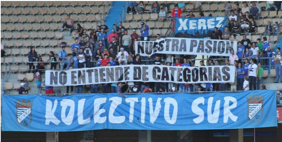
Kolectivo Sur animando al Xerez DFC.