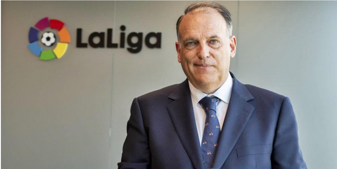
Javier Tebas, actual presidente de la LFP.