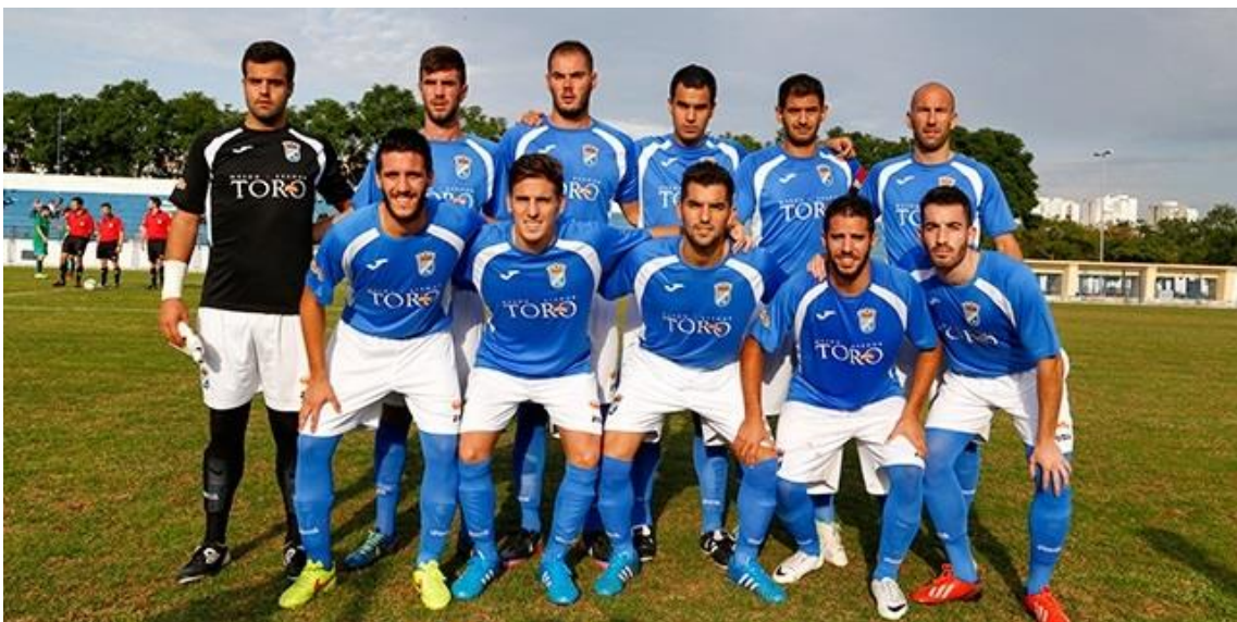
Xerez CD, temporada 2014-2015.