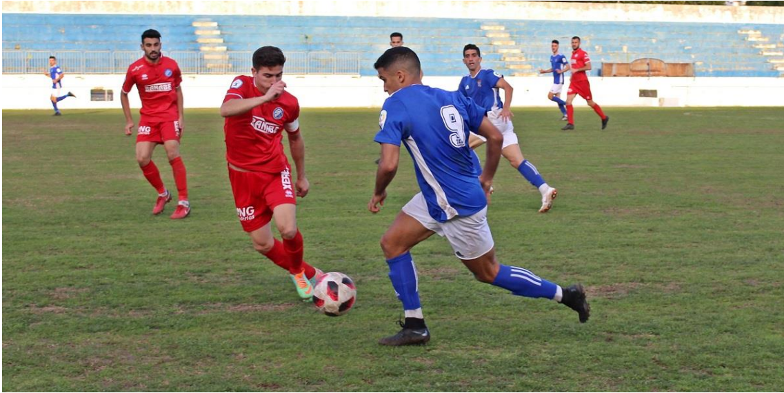
Un lance del juego durante el Xerez CD-Xerez DFC./ Alejandro Jiménez

En la actualidad, Xerez CD y Xerez DFC se reparten los socios. El histórico CD ha registrado en la última temporada una cifra cercana a los 1000 socios en Tercera División, mientras que el nuevo Xerez ha alcanzado 3000 socios en la misma categoría. Entre ambos clubes sumarían unos 4000, por lo que es una realidad que hay miles de personas que en un pasado acudían a Chapín a ver al Xerez CD y en la actualidad se han perdido en el limbo dada la división existente en el xerecismo.