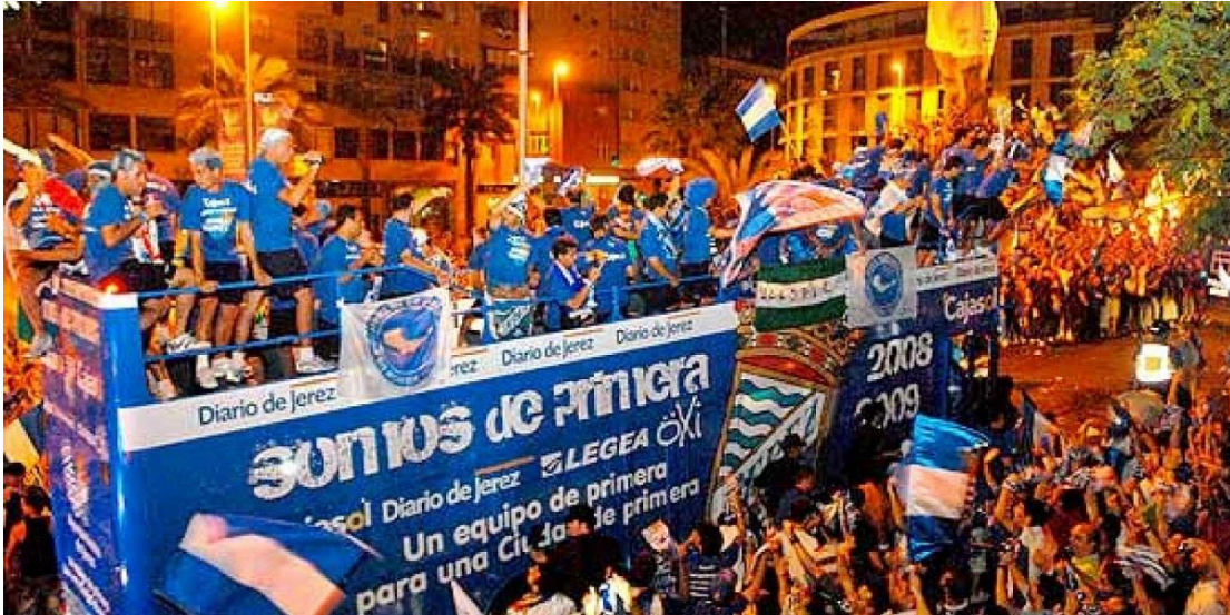
El xerecismo celebra el ascenso a Primera División en la temporada 2008-2009.