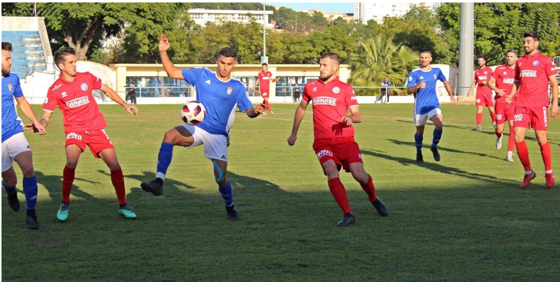
Un lance del juego durante el Xerez CD-Xerez DFC de la temporada 18-19.