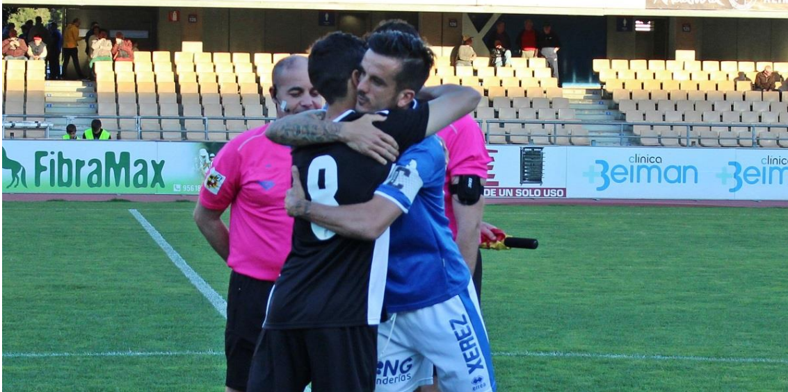
Los capitanes de Xerez DFC y Xerez CD se abrazan antes del choque.

Primero, la unión se gestó entre representantes de Xerez CD y Xerez DFC, y todo parecía que llegaría a buen puerto. Los mencionados representantes debían trasladar a sus respectivos aficionados las cuestiones tratadas en la reunión y los condicionantes que supondría una unión entre ambos clubes.