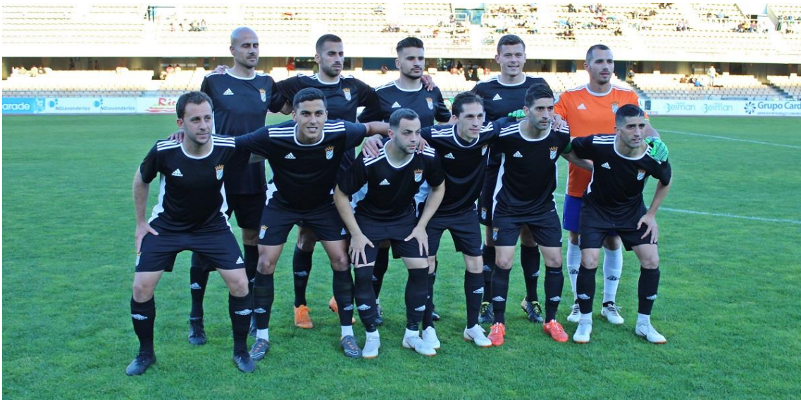
Plantilla Xerez CD temporada 2018-2019.